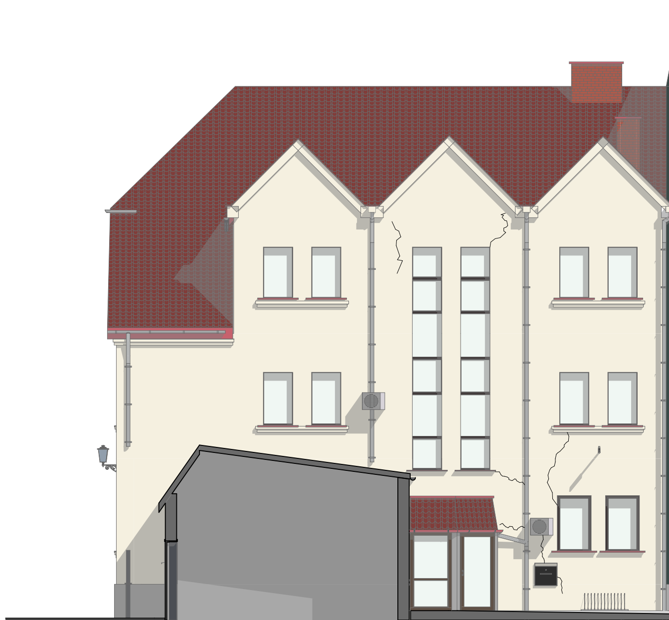
E-PD Elewacja TYLNA Południowo-Wschodnia 1:100