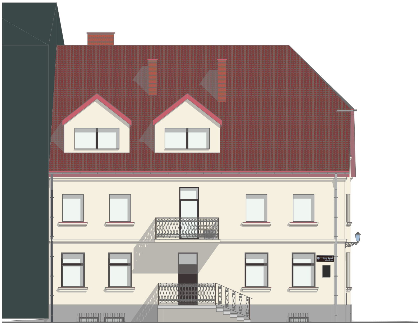
E-PN Elewacja FRONTOWA Północno-Zachodnia 1:100